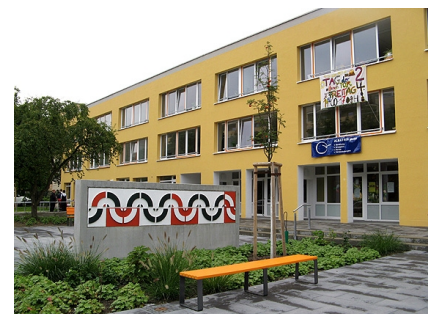
Der einladende Vorplatz - ein Mosaik der Kita wurde wiederverwendet