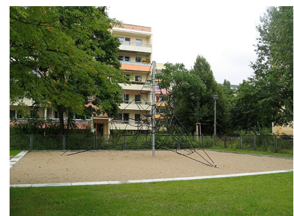
Der neu gestaltete Garten der Kita 2012