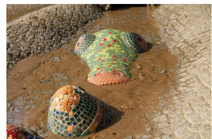
Im Wasserspielplatz steckt viel Fantasie und Liebe zum Detail