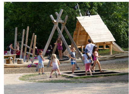
Piratenspielfeld mit Trampolin - alles ist erlaubt