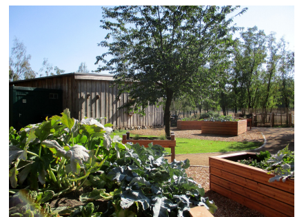
Neue Hochbeete erleichtern das barrierefreie Gärtnern