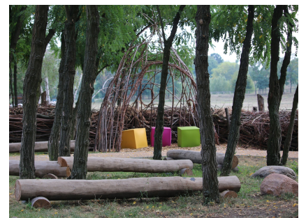
2019 entstanden ein Aktionspfad und ein grünes Klassenzimmer