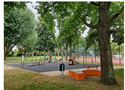
Die Anlage unweit des Jugendclubs Geschwister-Scholl-Haus