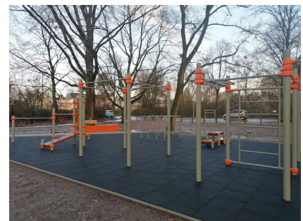
Die fertige Anlage im Dezember 2023