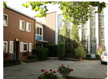
Begegnungszentrum und Kirche "Zuversicht" 2017