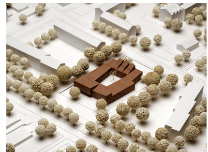
Modellfoto des 1. Preises